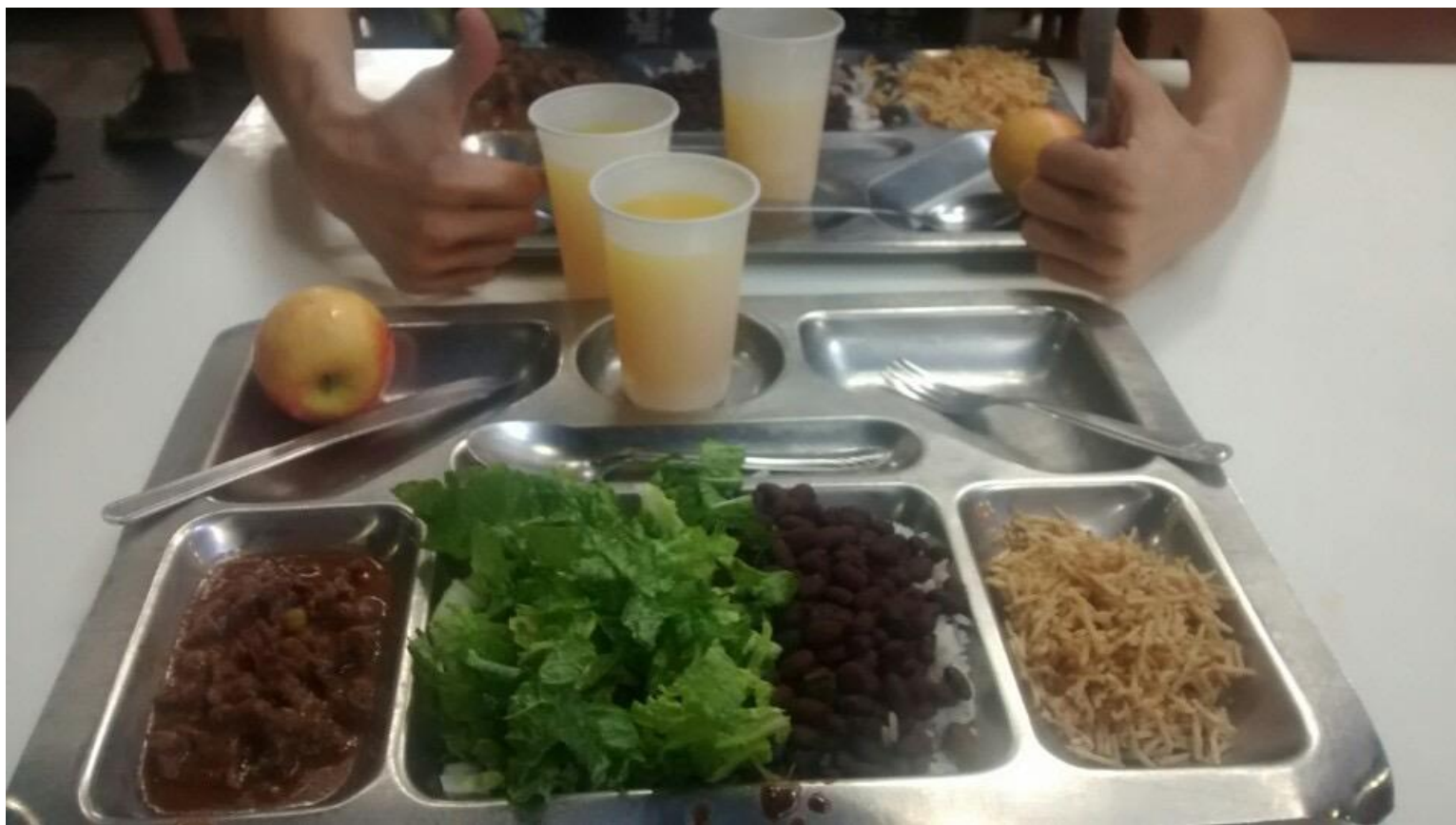
Vista interna do Restaurante Setorial de Alegre