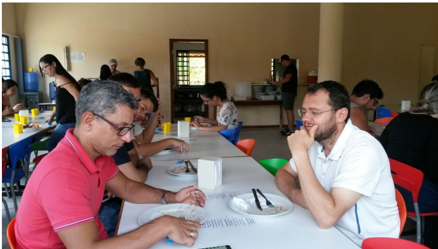
Vista interna do Restaurante Setorial de Jerônimo Monteiro