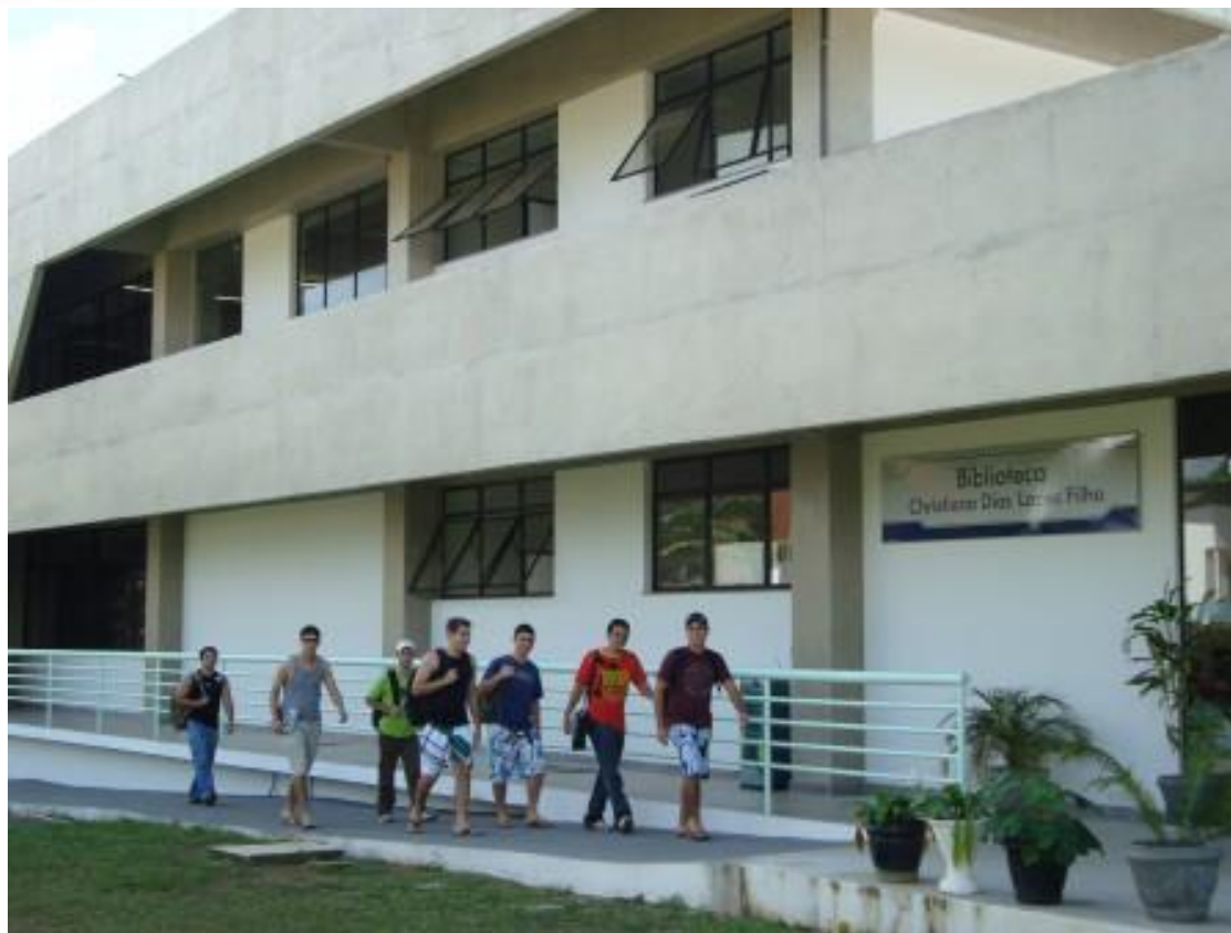
Prédio da Biblioteca Setorial de Alegre