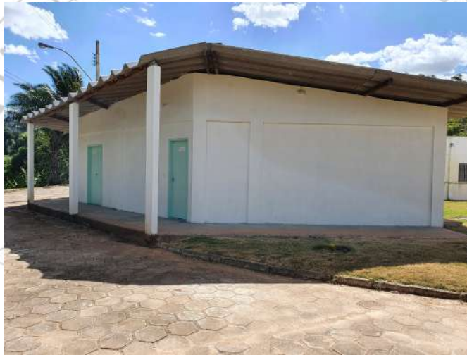
Construção da Lavanderia e Esterilização

Obras e equipamentos concluídos/adquiridos no ano de 2020.