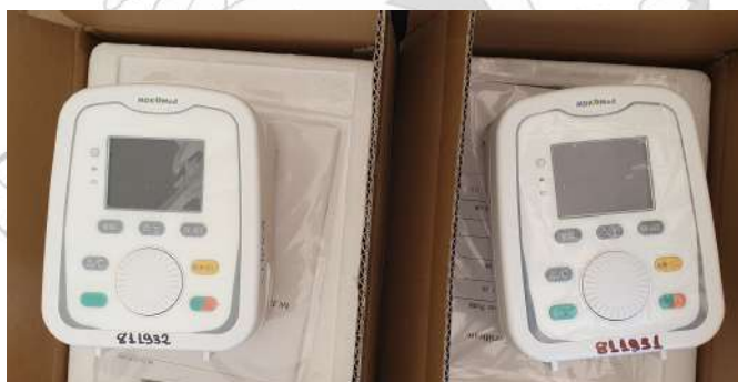
Aquisição de Bomba de Infusão para o Centro Cirúrgico e Clínica Médica