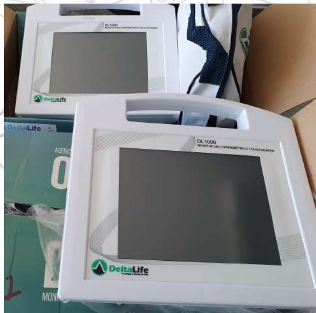
Aquisição de monitor multiparamétrico para o Centro Cirúrgico e Clínica Médica de Animais de Companhia.