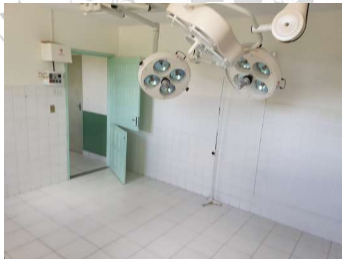
Obra de Reforma do Centro Cirúrgico

Obra de Reforma dos Canis de Internação/infectórios.