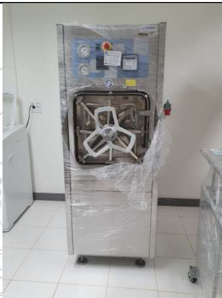
Aquisição de Autoclave Horizontal 100 litros.