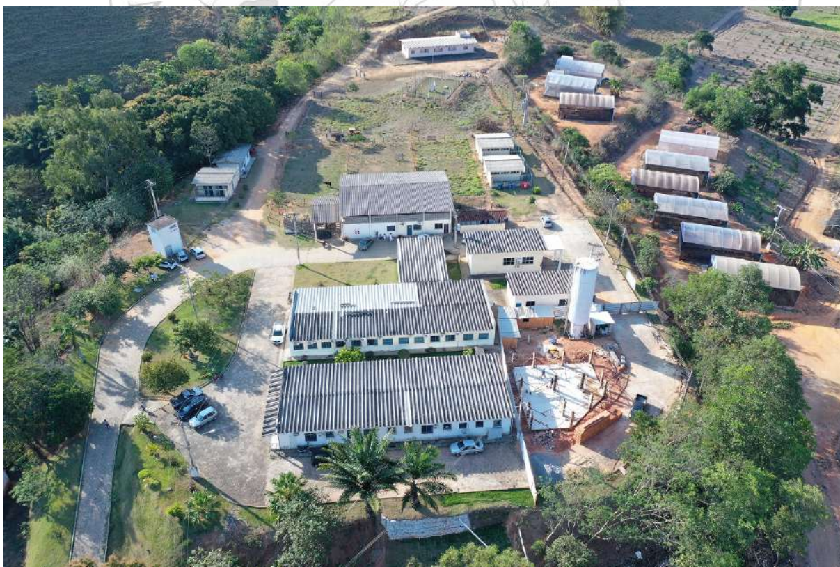
Imagem aérea do Hospital Veterinário da Ufes

No ano de 2020 o HOVET, como quase todos os setores da instituição, foi afetado pela pandemia e pelo seu fechamento a partir do mês de março, permanecendo apenas o atendimento aos animais de propriedades da UFES, nas áreas experimentais de Rive e de São José do Calçado.