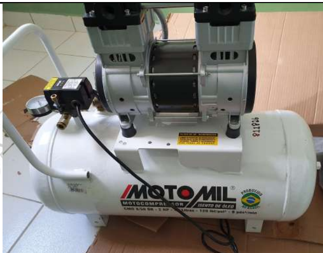
Aquisição de compressor de ar odontológico para o Centro Cirúrgico